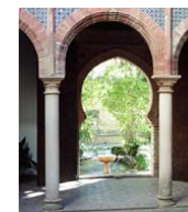
Jardín del Museo de Ronda